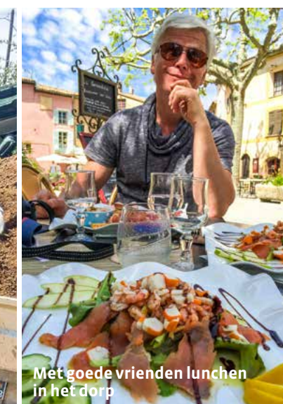
Met goede vrienden lunchen in het dorp