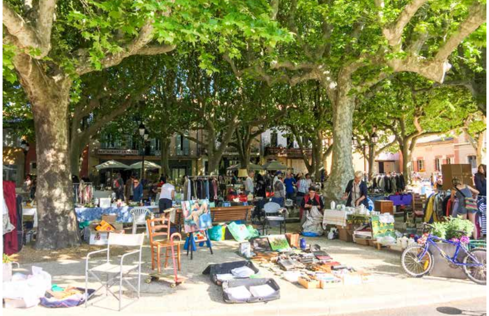
Jaarlijkse rommelmarkt in Villecroze