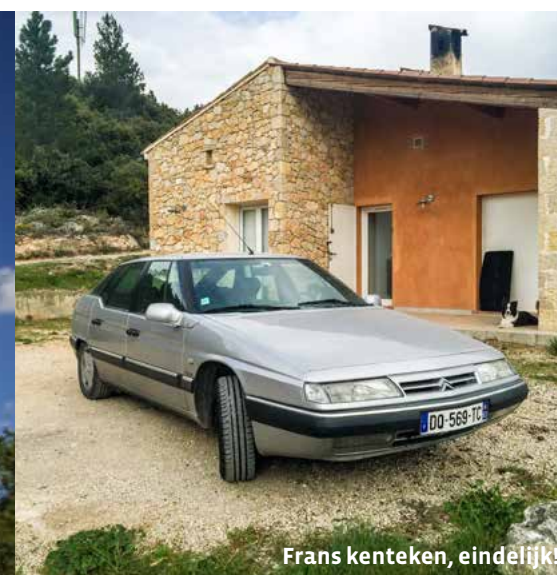
Frans kenteken, eindelijk!