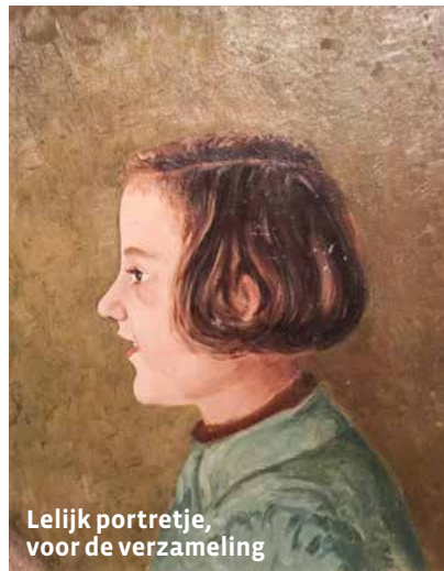
Lelijk portretje, voor de verzameling