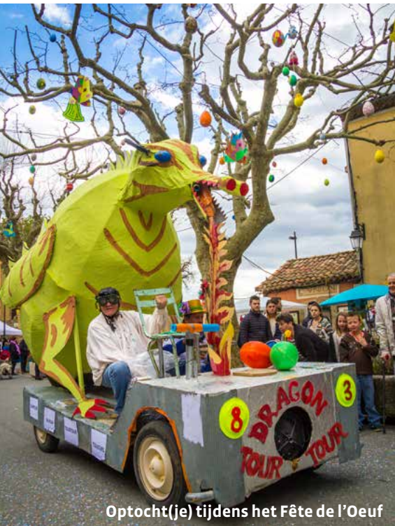
Optocht(je) tijdens het Fête de l'Oeuf